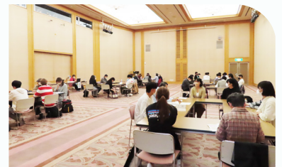
過去の会場の様子